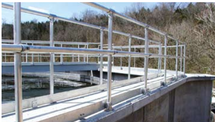
Tennessee, Stany Zjednoczone