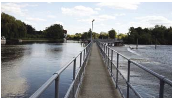
Hambledon Weir, Wielka Brytania